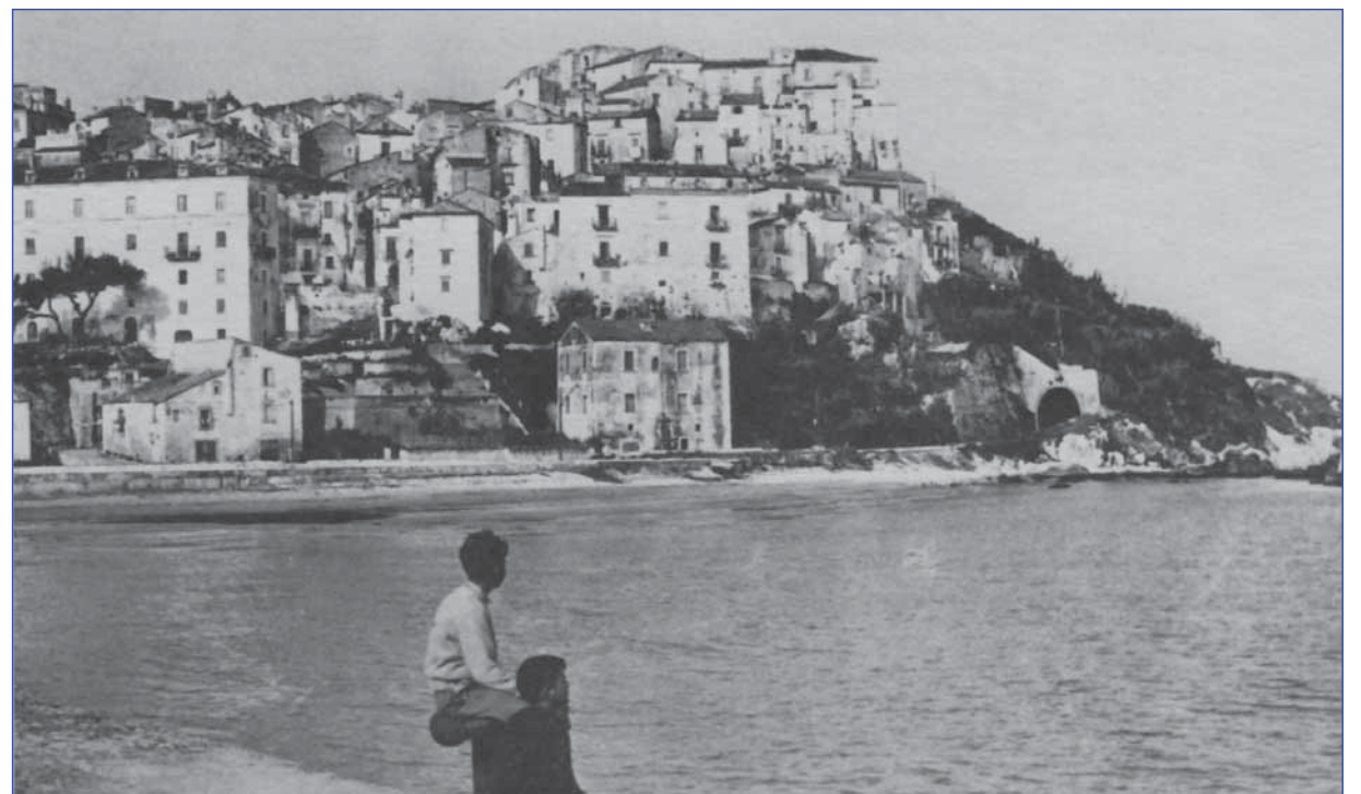
A proposito de L'idioma di Rodi, del dialetto e delle sue regole