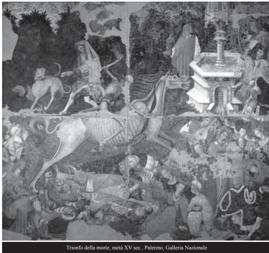
Trionfo della morte, metà XV sec., Palermo, Galleria Nazionale