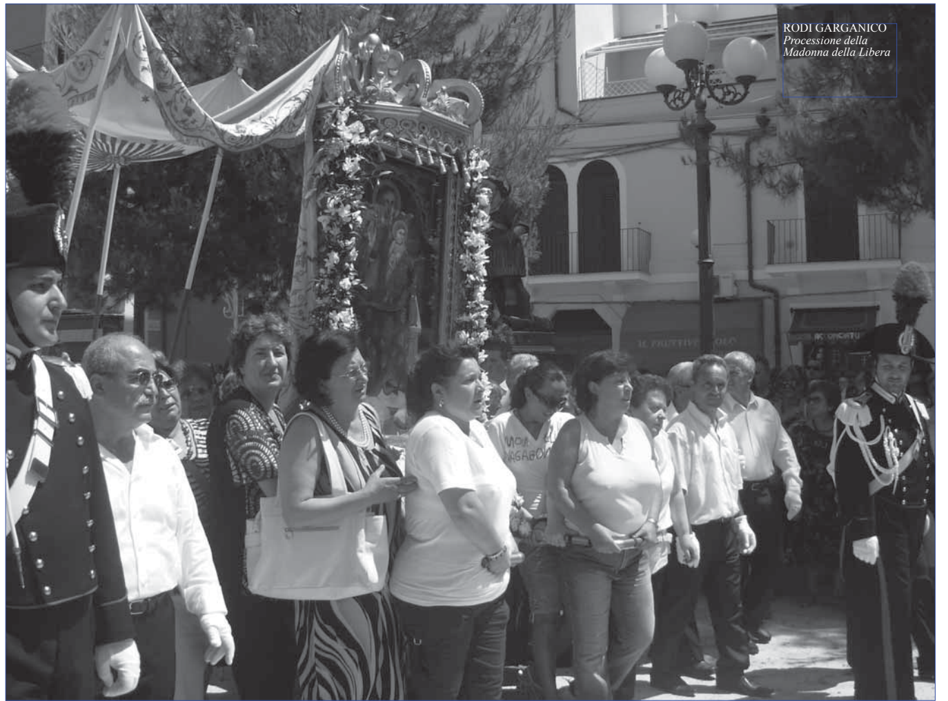
RODI GARGANICO Processione della Madonna della Libera